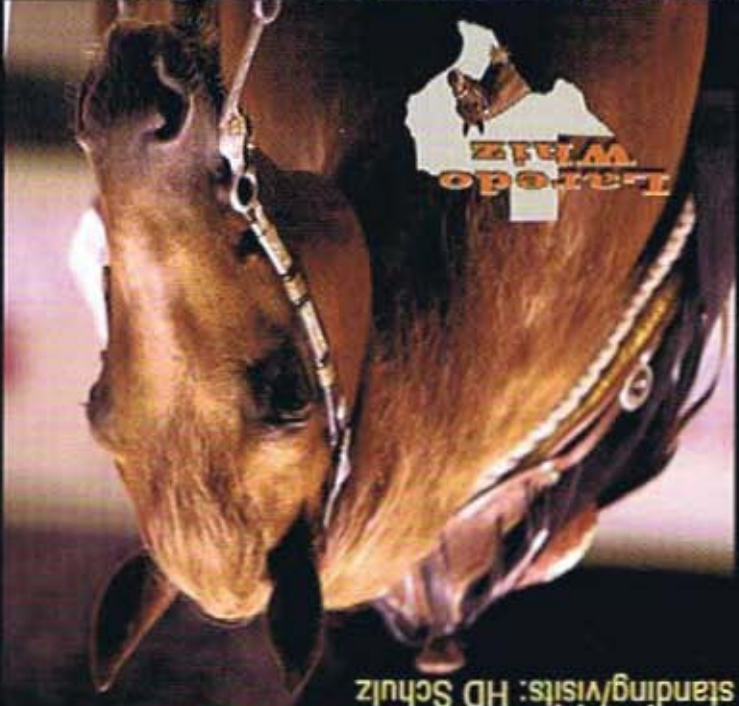
Breeding information: www.dainmasa.at standing/visits: HD Schulz

- Gewinnen am gleichen Kalendertag mehrere bezugsberechtigte Nachkommen (ex aequo, versch. Orte, versch. Altersklassen) und haben alle ihren Anspruch fristgerecht angemeldet, so wird der Betrag zu gleichen Teilen aufgeteilt.